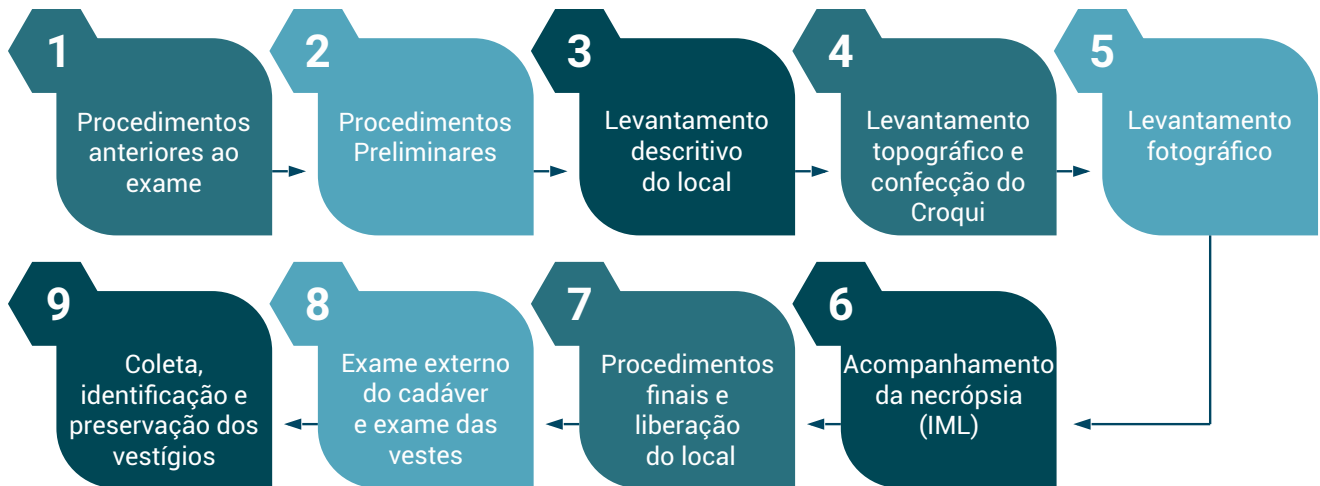
Figura 1 - Sequência de etapas de um levantamento de local de crime