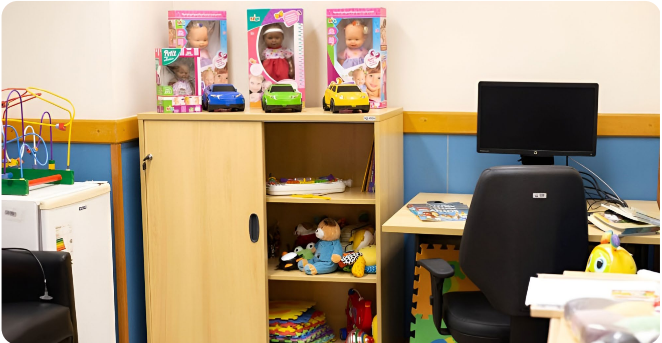
Brinquedoteca do Centro Especializado de Atenção às Vítimas do TJ/RJ.